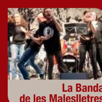
La Banda de les Maleslletres