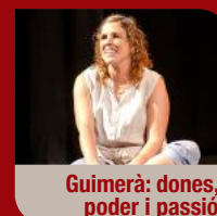
Guimerà: dones, poder i passió