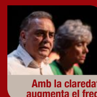
Amb la claredat augmenta el fred